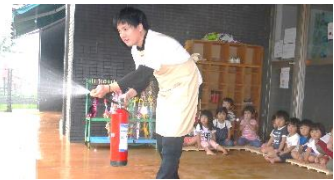
「119」に電話をし通報訓練(消火訓練)を行いました。

9月1日は 防災の日 です。園でも日頃から地震や火災などの避難訓練を実施しています。この日を機会にご家庭でも水や非常食、懐中電灯の準備、家族の集合場所の確認を行ってみたいはいかがでしょうか。「備えあれば憂いなし」ですね。 (スマホが使えない時、ご家族の連絡先は分かりますか???)